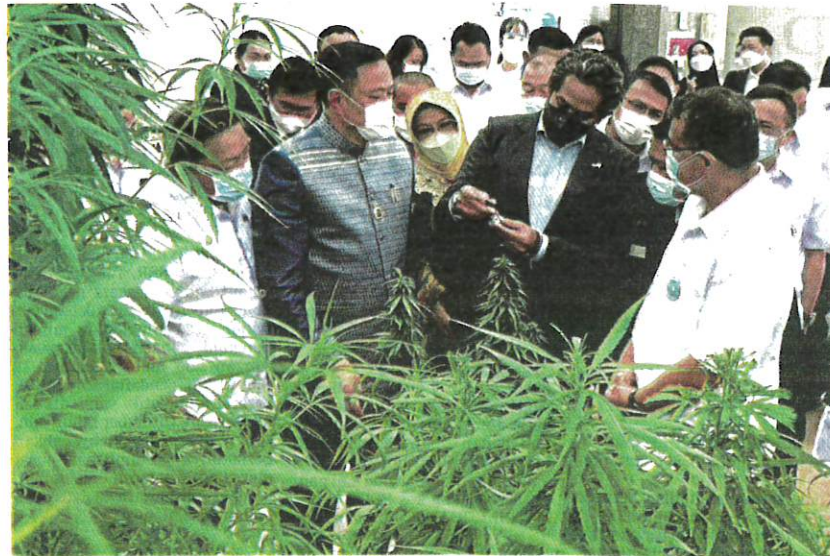
Khairy (dua dari kanan) bersama Anutin (dua dari kiri) melihat tanaman dan produk kanabis ketika melawat GPO di Pathum Thani Bangkok, semalam.

jadi negara Asia Tenggara pertama membenarkan penanaman dan pemilihan kanabis untuk perubatan.