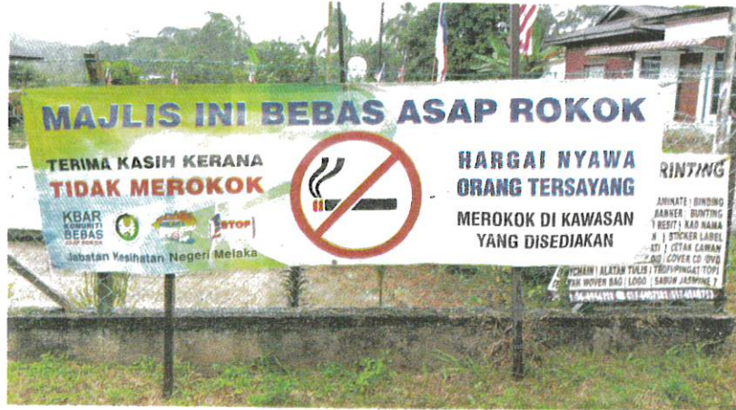
KAIN rentang dipasang di Balai Raya Kampung Sungai Jernih, Lubok Cina, Melaka yang memaklumkan kawasan itu bebas asap rokok.

"KKM menetapkan syarat tidak boleh memiliki sebarang jenama rokok dalam rumah termasuk pada barang peribadi. Justeru, Kampung Sungai Jernih tampil untuk