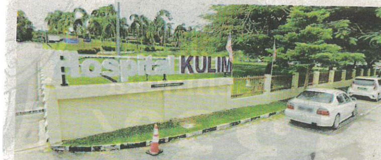
HOSPITAL Kulim telah menunda pembedahan seorang pesakit yang mempunyai masalah ketulan pada bahu sebanyak tiga kali.

“Dalam tempoh pemulihan perkhidmatan sekarang, kes-kes yang memerlukan pembedahan segera dan kecemasan seperti berkaitan trauma, kanser dan pembedahan caesarean serta kes-kes tertangguh dalam tempoh pandemik lalu akan diberi keutamaan berbanding kes lain,” ujarnya.